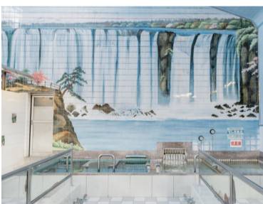
風情ある滝のタイル絵が美しい現在の洗い場。

建物からも昭和の懐かしい風情が漂う。美しい宮造り建築は二人が購入した時からしっかりと守ってきたものだ。外観のみならず、脱衣場の立派な格天井、洗いの全面に広がる豪華な滝のタイル絵は圧巻だ。建物の手入れも長年にわたつ