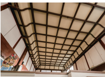
脱衣場は格天井で広々としている。

まさに地域を愛し、地域に愛されている銭湯だが、現在は子どもたちも営業に加わり、手を取り合いながら営業しているという。美しい宮造り建築を維持しながら、その火を灯し続けてほしいものだ。